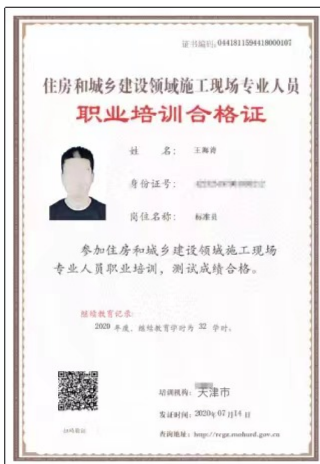
电子培训合格证统一式样